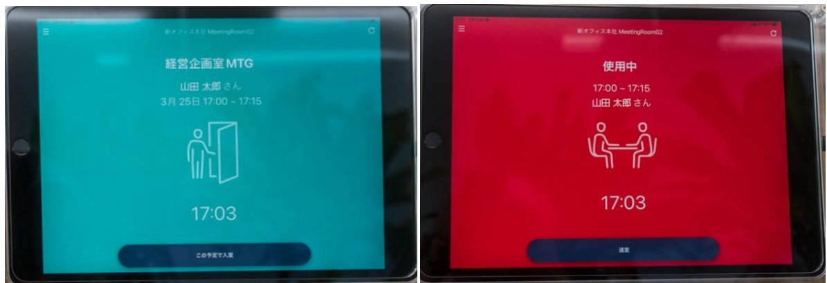
会議システムの導入(会議室使用前:左 会議室使用中:右)

各会議室に会議システムを導入し、会議室の外からでも現在誰が使用しているのかすぐに把握が可能となったことで会議室の無駄な空き状況を無くしました。また、会議終了の数分前に室内のモニターから音が鳴ることで、時間を意識した効率的な会議の運用が可能となります。