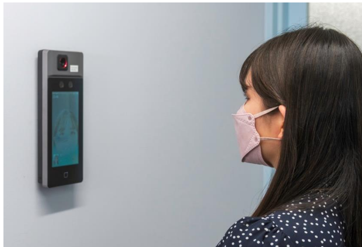
マスク着用のまま可能な顔認証システム