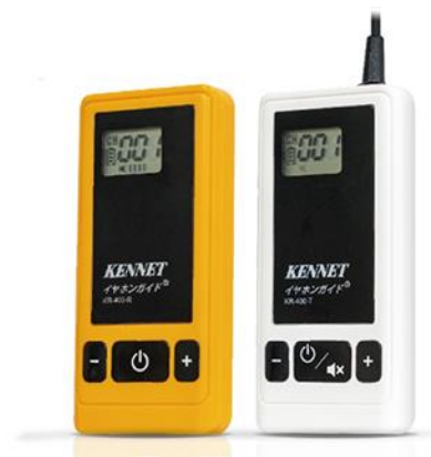
▲イヤホンガイド KR-400 (左) 受信機 (右) 送信機

イヤホンガイドは、観光地を中心に年間約70万人にご利用いただいている送信機と受信機からなる無線ガイドレシーバーです。1997年の発売以来、観光地をはじめ、工場・施設見学、美術館・博物館、セミナー会場、国際会議での同時通訳、スポーツ会場での解説など幅広いシーンで利用されています。旅行関連市場では90%以上の国内シェアを有しており、新型コロナウイルス感染防止に有効な「3密回避」ツールとしても各業界から好評いただいております。