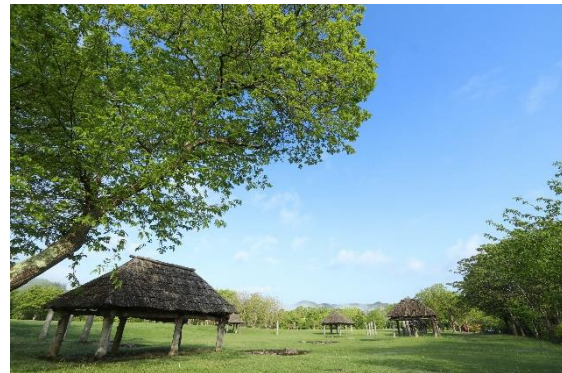
▲御所野遺跡 中央ムラ

御所野遺跡は、今から約5,000～4,200年前の縄文時代中期後半の遺跡で、国の特別史跡として通年公開されている岩手県を代表する人気観光スポットです。本年7月27日に、御所野遺跡を含む「北海道・北東北の縄文遺跡群」について、国連教育科学文化機関（ユネスコ）により世界遺産への登録が正式に決定いたしました。