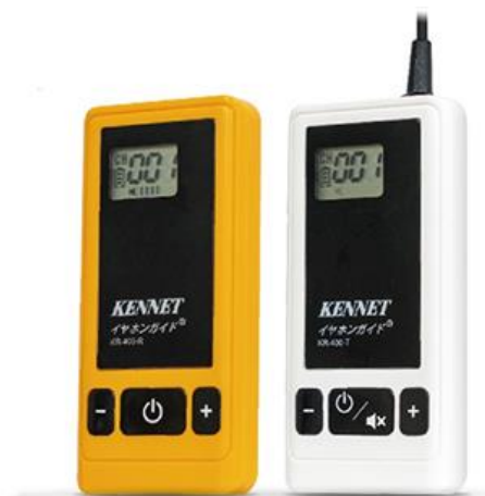
▲イヤホンガイド KR-400 (左) 受信機 (右) 送信機

イヤホンガイドは、観光地を中心に年間約70万人にご利用いただいている送信機と受信機からなる一方向の無線ガイドレシーバーです。1997年の発売以来、観光地をはじめ、工場・施設見学、美術館・博物館、セミナー会場、国際会議での同時通訳、スポーツ会場での解説など幅広いシーンで利用されています。旅行関連市場では90%以上の国内シェアを有しており、「新型コロナウイルス感染防止対策ツール」としても各業界から好評いただいております。