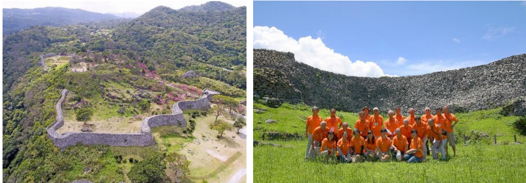
▲今帰仁城跡（左） 今帰仁グスクを学ぶ会 ガイドの様子（右）