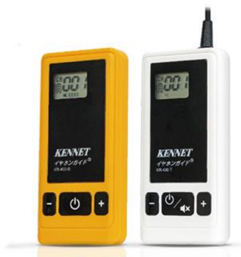
▲イヤホンガイド KR-400 (左) 送信機 (右) 受信機