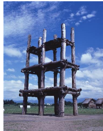
▲三内丸山遺跡 (左) 掘立柱建物 (右) 大型掘立柱建物跡

三内丸山遺跡は、今から約5,900～4,200年前の縄文時代の日本最大級の集落跡で、国の特別史跡として毎年公開されている青森県を代表する人気観光スポットです。本年5月26日には、三内丸山遺跡を含む「北海道・北東北の縄文遺跡群」について、国連教育科学文化機関（ユネスコ）の諮問機関、国際記念物遺跡会議（イコモス）から世界遺産一覧表に「記載」することが適当である旨の勧告がなされ、7月に正式決定される見通しです。