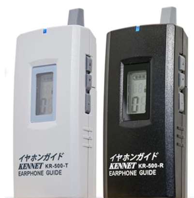
▲イヤホンガイド KR-500 (左) 送信機 (右) 受信機