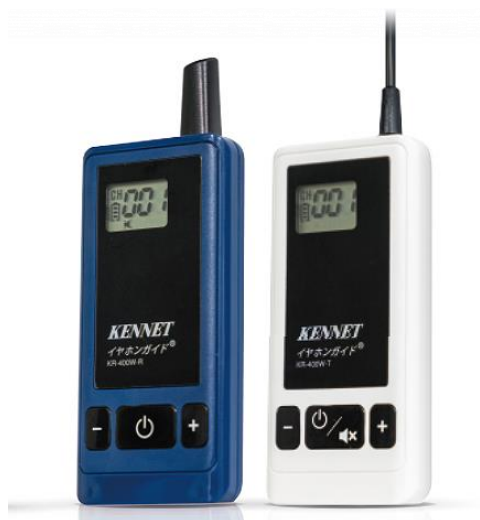
イヤホンガイド最新機種 KR-400W (左)受信機 (右)送信機

イヤホンガイドは、送信機と受信機からなる無線ガイド機で、旅行会社の団体ツアーやイベント等の顧客満足度を上げるツールとして1997年に誕生したケンネットのロングセラー商品です。