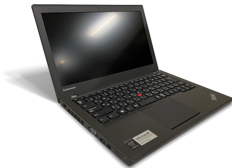
<今回寄贈したリユース PC>

※1：ライフサイクルマネジメント：IT 機器の導入、運用・管理、使用後の機器の排出、適正処理を管理する仕組み