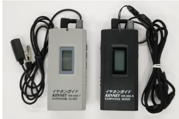
イヤホンガイド KR-500 (左)送信機 (右)受信機