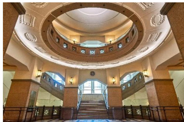
港区立郷土歴史館・内観