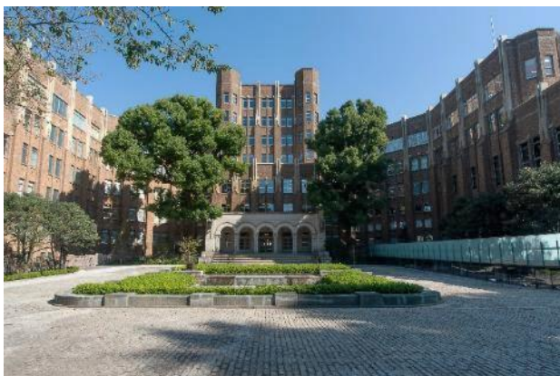
港区立郷土歴史館・外観

ケンネットでは、ますます増える観光需要に対応し、今後も本製品の提供を拡大してまいります。