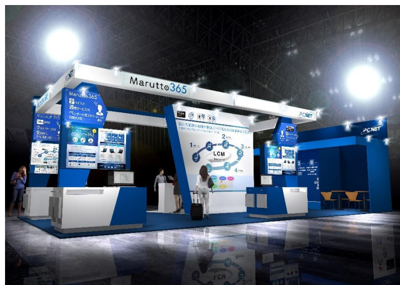
<出展ブース イメージ図>