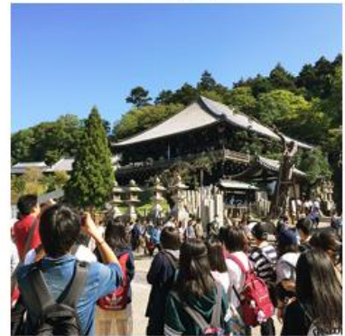
▲国内外旅行・見学

近年、国際的に高まるキャッシュレス化決済導入の機運が高まる中、2020年の東京オリンピックを目前に控えた我が国でも、政府が積極的に決済手段の多様化を推進しています。