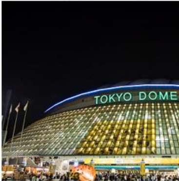
▲スポーツイベント