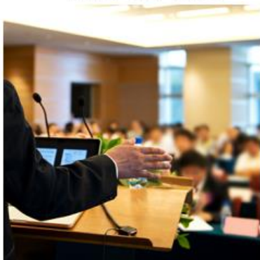
▲国際会議・セミナー 同時通訳