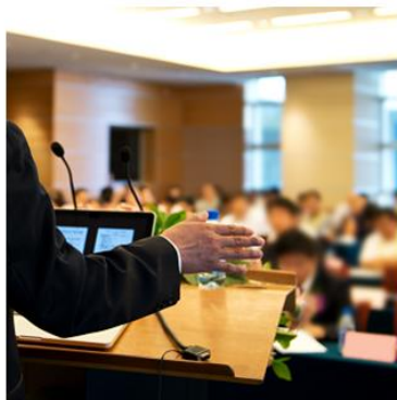
▲国際会議・セミナー