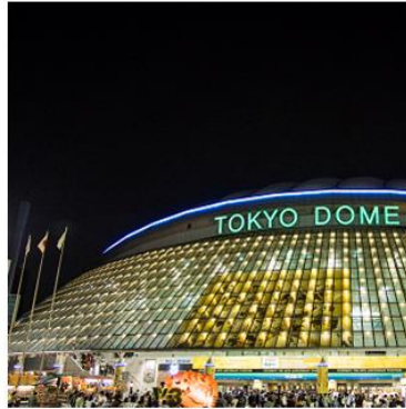
▲スポーツイベント